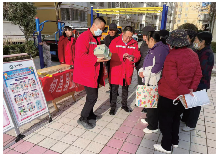
群众温暖安全过冬。

开展。活动现场向过往群众发放安全用气手册、海报等宣传资料,详细讲解天然气泄漏应急处置、燃气热水器规范使用、软管老化更换等实用知识,结合典型事故案例警示群众重视用气安全。同时,利用微信公众号推送安全用气小贴士,构建多维度宣传矩阵,确保安全知识全覆盖,筑牢冬季用气安全防线,守护